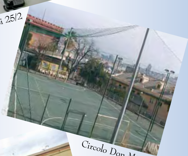
Circolo Don Minetti