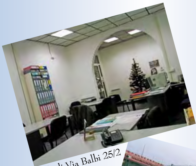
Sede di Via Balbi 25/2