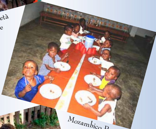
Mozambico Progetto Macibombo