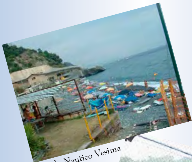
Circolo Nautico Vesima