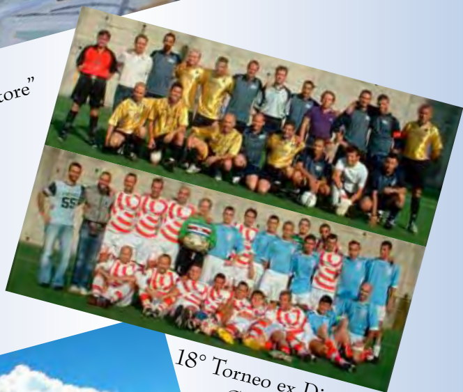
18° Torneo ex Direttore Compartimentale