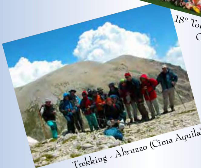
Trekking - Abruzzo (Cima Aquila)