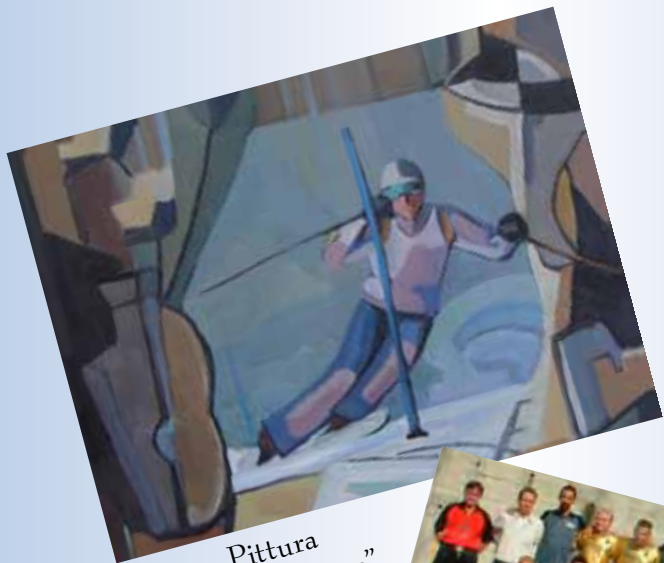
Gruppo Pittura G. Buffa "Sciatore"