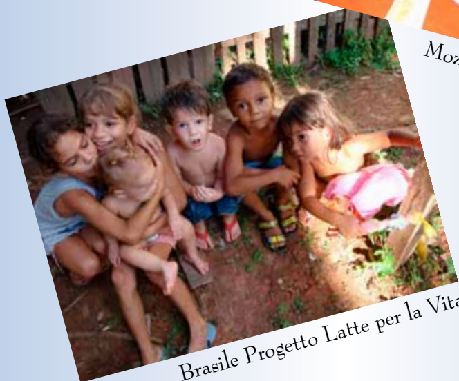
Brasile Progetto Latte per la Vita