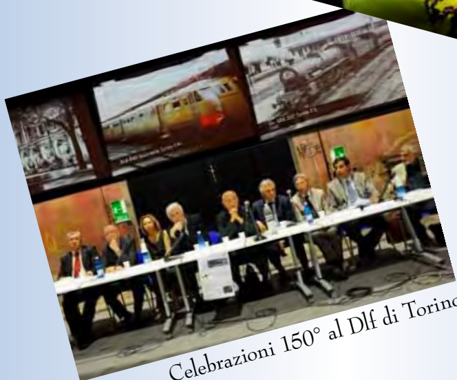
Celebrazioni 150° al DIF di Torino