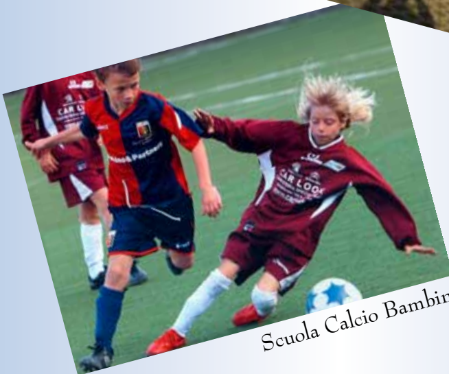
Scuola Calcio Bambini