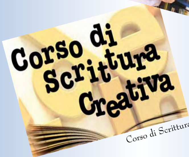
Corso di Scrittura