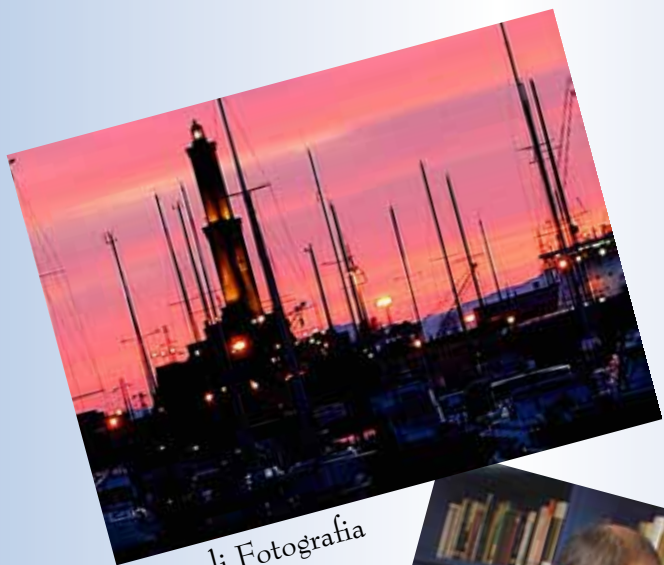
Corso di Fotografia