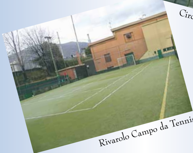
Rivarolo Campo da Tennis