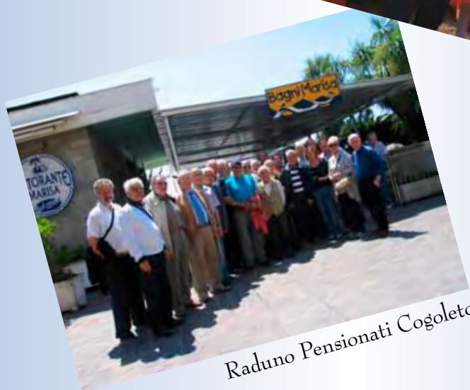
Raduno Pensionati Cogoleto