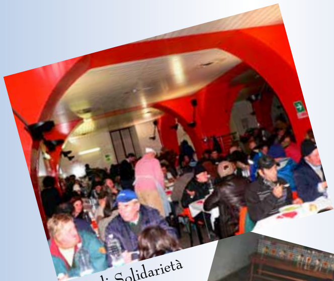
Cena di Solidarietà Genova Principe