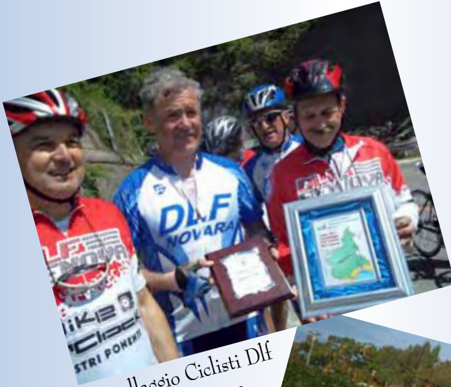
Gemellaggio Ciclisti Dlf di Novara e Genova